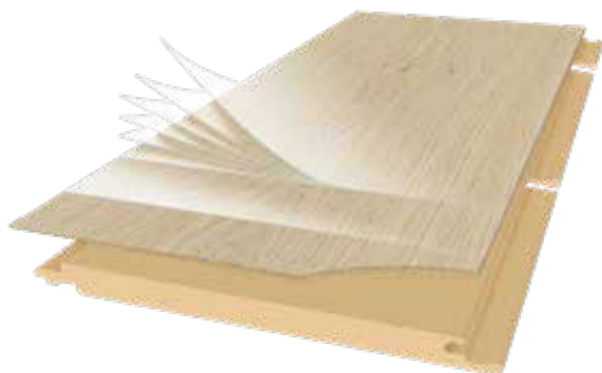
parqwood xl & xxl long